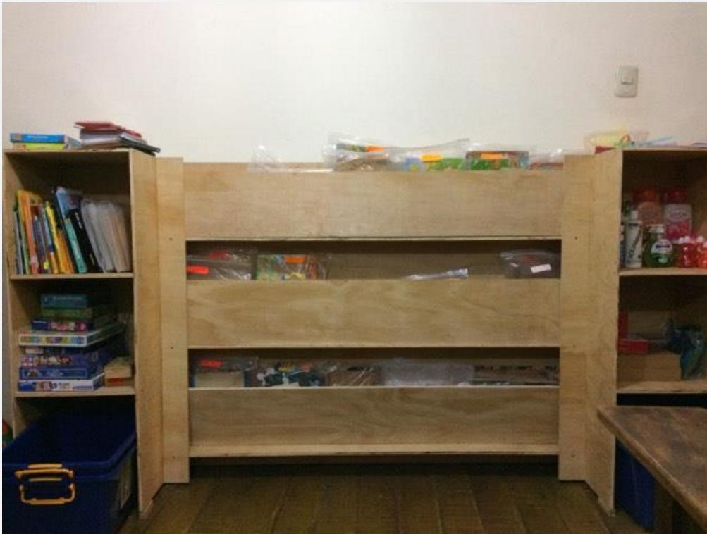
DE oplossing om de puzzels wat geordender te hebben in de speel-o-theek