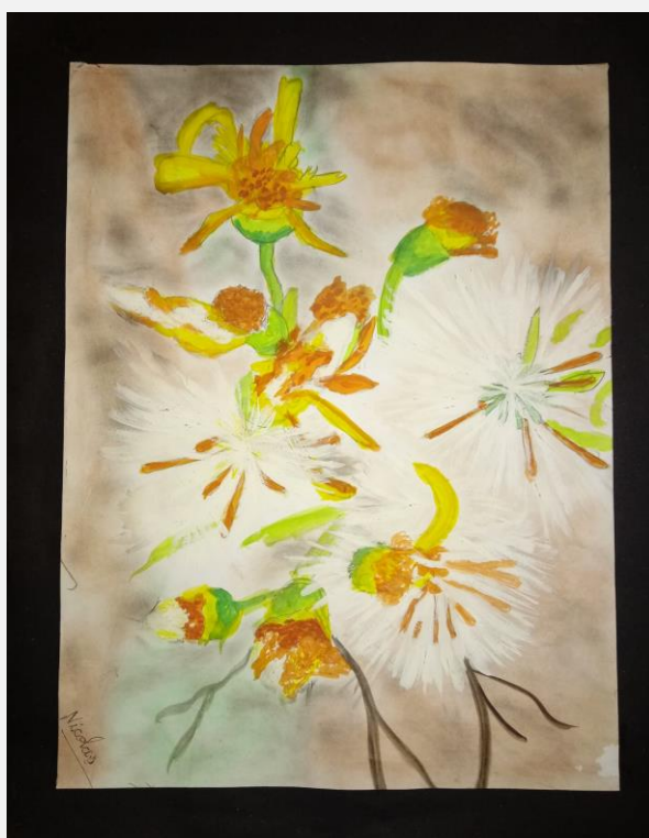
Schilderij van Nicolas, als dank-je-wel aan Abrazos