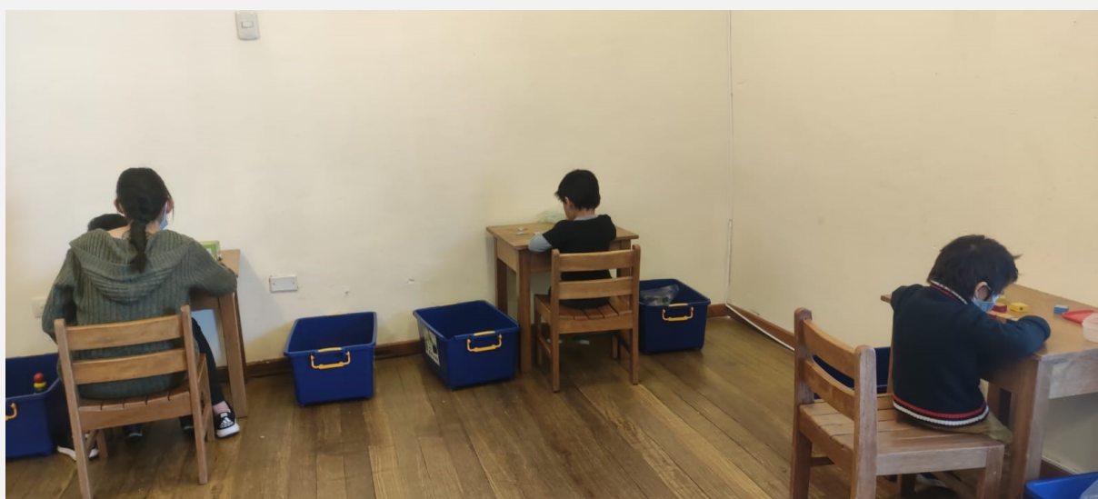
Groepstherapie weer sinds lange tijd!