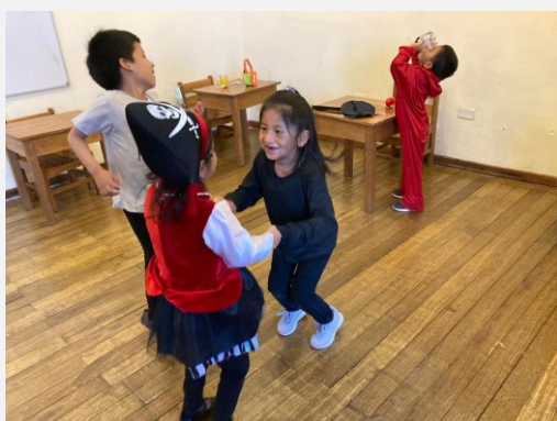
Dansen tijdens het Halloweenfeest in de vrijetijdclub

Het bestuur heeft overwegend contact gehad via telefoon of videogesprekken om te brainstormen of te vergaderen. Eind september heeft ook weer de eerste fysieke bestuursvergadering plaatsgevonden.