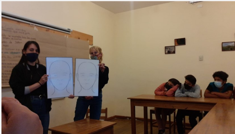
Brain Blocks in gebruik om het autisme van hun woongenoot uit te leggen