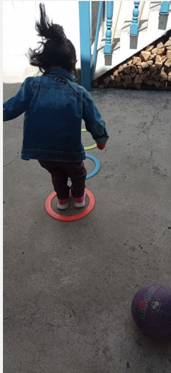
Buitenspelen in de pauze van de groepstherapie

aanvulling om de overbrugging te kunnen maken van een door fondsen gefinancierd centrum tot een volledig zelfstandig financierend centrum. Doel was om in drie jaar deze transitie te maken waarbij Abrazos vanaf 2022 volledig zelfstandig kan functioneren. In 2018 en 2019 hadden we hier al een aantal mooie stappen op gezet, maar helaas hebben we door de Coronacrisis een pas op de plaats moeten maken. Peru en met name Cusco is zwaar geraakt door de economische crisis omdat het erg afhankelijk is van toerisme en dit volledig stil ligt. De verwachting is dat ook in 2022 de gevolgen nog merkbaar zullen zijn. Aan de ene kant hebben we de prijzen van onze service verhoogd, om de inflatie te corrigeren en uiteindelijk volledig kostendekkend te kunnen werken. Aan de andere kant zijn we ons ervan bewust dat komend jaar meer families gebruik zullen moeten maken van het sociale pakket. Voor het sociale pakket zullen we dan ook actief fondsen moeten werven en acties hier in Peru organiseren. We lopen ernstige vertraging op bij het bereiken van zelfstandige financiering maar blijven we er wel naar streven zo goed als we kunnen.