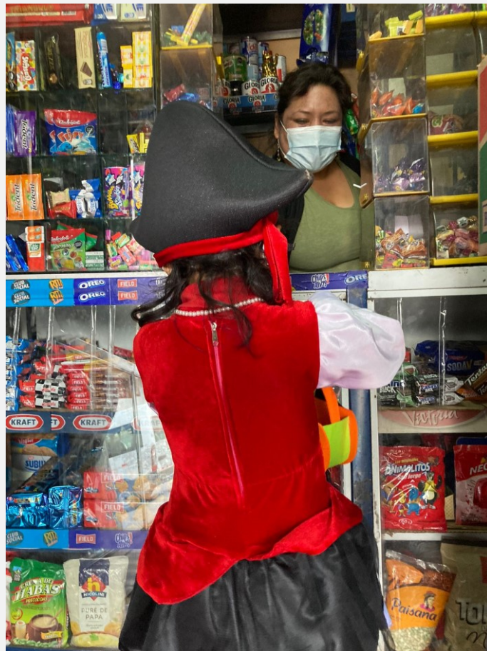
Oefenen snoep vragen met de juiste sociale vaardigheden, geleerd in de club