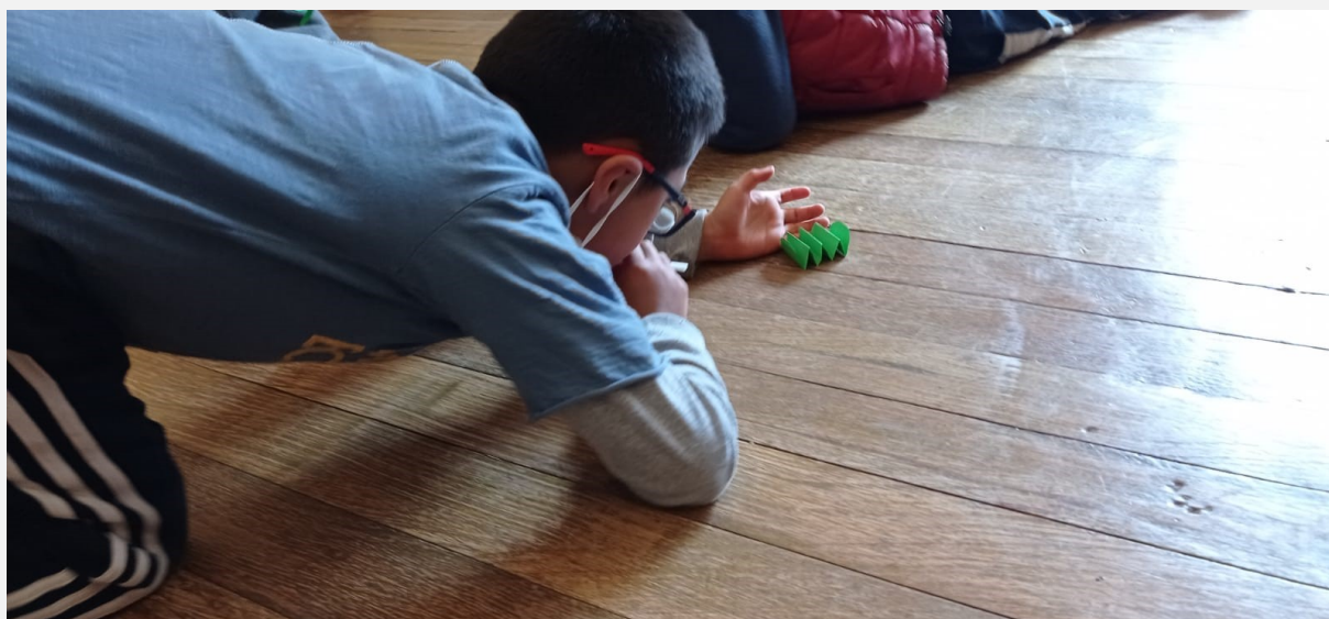
Spelletje tijdens de club