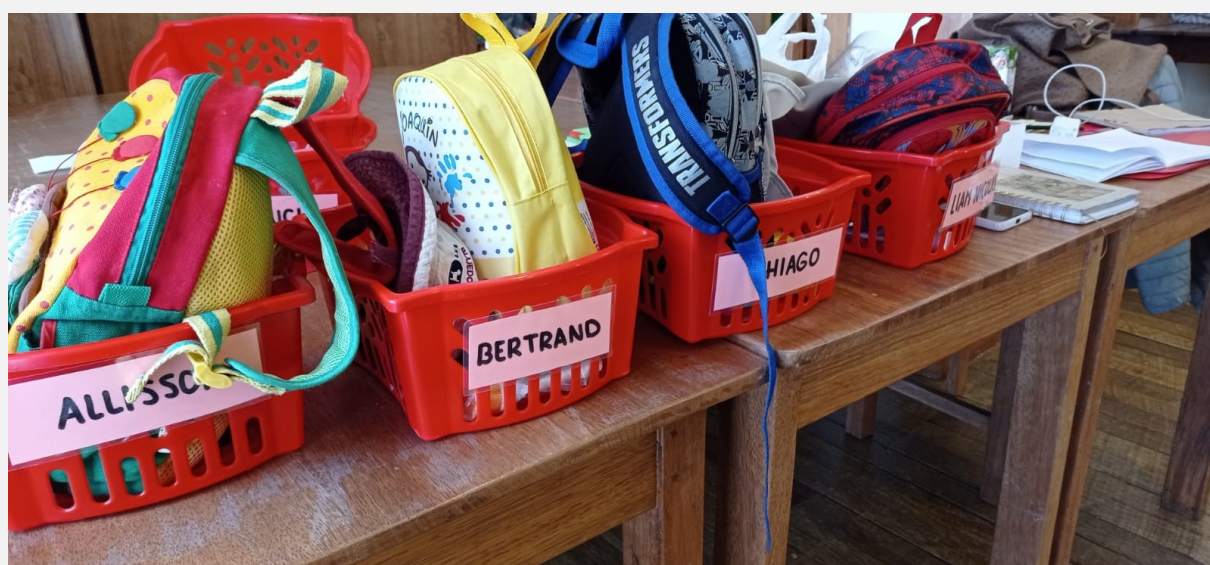
Alle rugzakjes in hun vaste mandje bij binnenkomst in de groepstherapie