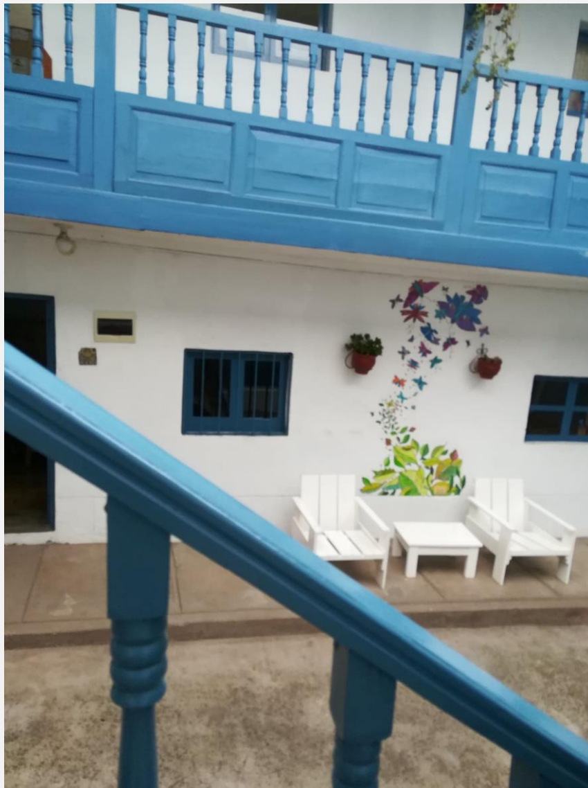
Het gebouw van Abrazos door de ogen van een jongen van de vrije tijds club