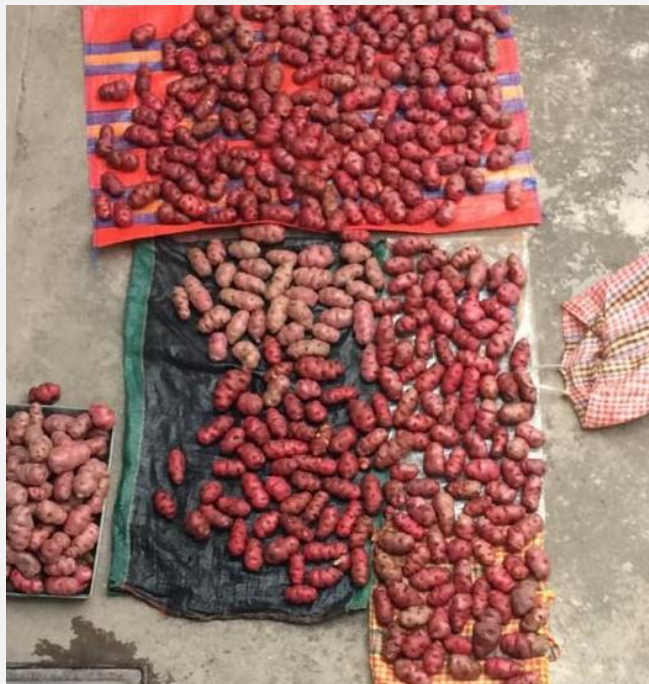
Vorbereiden van de Pollada – all gewassen aardappelen

Het idee was dat het sociale pakket zelf geld zou werven in Peru om de gezinnen uit de lagere sociale klasse te helpen bij het betalen van hun therapieën. Ondanks dat er wel initiatieven zijn zoals de verkoop van stroopwafels en ijsjes en de organisatie van evenementen zoals een Pollada zijn de inkomsten niet voldoende om het sociale pakket te kunnen financieren. Om de zorg aan de armste gezinnen te continueren zijn we genoodzaakt aanvullende middelen te werven. Ter illustratie: 30% van de bevolking in Cusco leeft in armoede, wordt sociaal buitengesloten en kan niet gebruik maken van zorg zoals die van Abrazos tenzij ze hierbij financieel worden ondersteund. Hoewel het sociale pakket momenteel niet leeg is, achten wij het verstandig om reserve te hebben zodat we deze zorg kunnen garanderen, iedere donatie voor het sociale pakket is welkom en kunnen we in 2021 goed gebruiken.